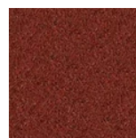
Rojo / Terracota